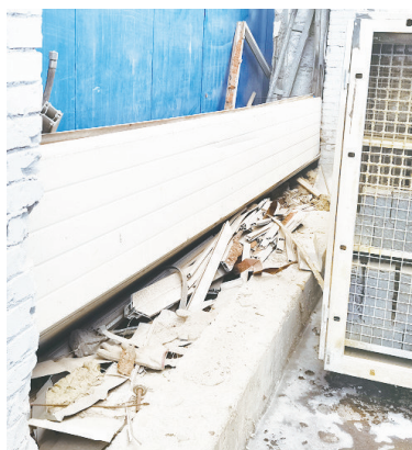
上图为工程机械焊接区域外环境存在卫生死角