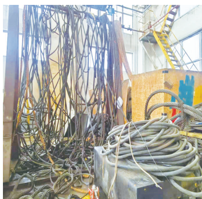
上图为起重机车间钢丝绳杂乱摆放