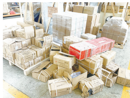
上图为采购中心机电库各类物品杂乱摆放